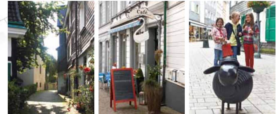
Kleine Läden und inhabergeführte Geschäfte in altem Fachwerk, Häuser im Bergischen Stil und verwinkelte Gassen sorgen für die besondere Atmosphäre in der Wülfrather Altstadt.